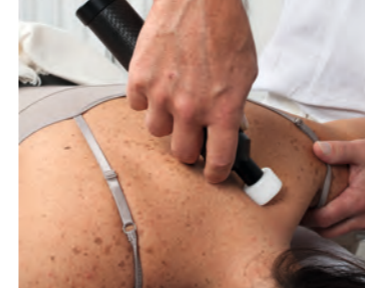
◀ Nackenbehandlung ▼ Schulterbehandlung

Mit dem Medizinprodukt Matrixmobil® behandelt der Therapeut Verhärtungen und Verkürzungen im Gewebe. Wenn die Muskelzellen durch die Behandlung sanft eingeladen werden, wieder mit zu pulsieren, kann sich die Zell-Logistik optimieren. Der lymphatisch-venöse Abfluss macht so frischen Metaboliten sowie Sauerstoff die Bahn frei. Die Heilungsprozesse des Körpers sind nicht mehr blockiert.