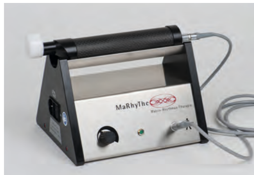
Matrixmobil® – Das Therapiegerät

Die „Matrix-Rhythmus-Therapie“ als solche und mithin die dem Gerätesystem „Matrixmobil®“ im folgenden beigegebenen Zweckbestimmungen, Wirkungsweisen und medizinischen Einsatzbereiche entstammen der Komplementärmedizin und begründen sich als Alternative und Ergänzung zu wissenschaftlich begründeten Behandlungsmethoden der Schulmedizin. Den Aussagen zu den genannten Therapiefeldern und Behandlungsmethoden liegen aktuell lediglich Studien kleiner Kohortengruppen, Pilotstudien, Anwendungsbeobachtungen und Erfahrungsberichte zugrunde. Es liegen keine Studien des Evidenzgrad Ib (methodisch hochwertige randomisierte placebo-kontrollierte Studie mit ausreichender Probandenzahl) oder der Stufe Ia (Metaanalyse auf der Basis mehrerer methodisch hochwertiger Studien der Stufe Ib) vor, sodass die Therapie, Methodik und die beschriebenen Behandlungsmöglichkeiten bislang als schulmedizinisch-wissenschaftlich nicht hinreichend gesichert und so als zumindest umstritten gelten.