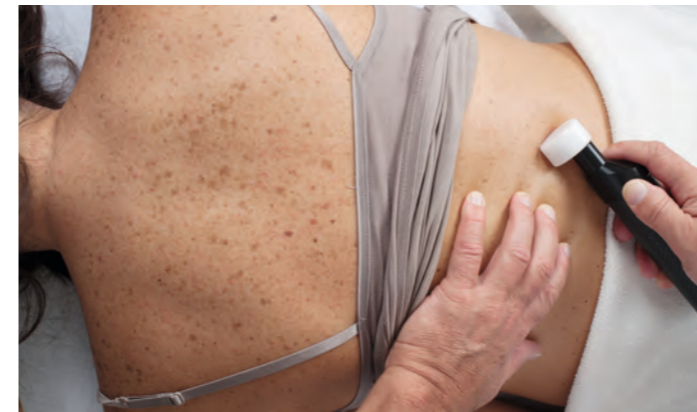
▲ Rückenbehandlung ▶ Kniebehandlung